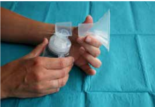
3. Set in elkaar zetten