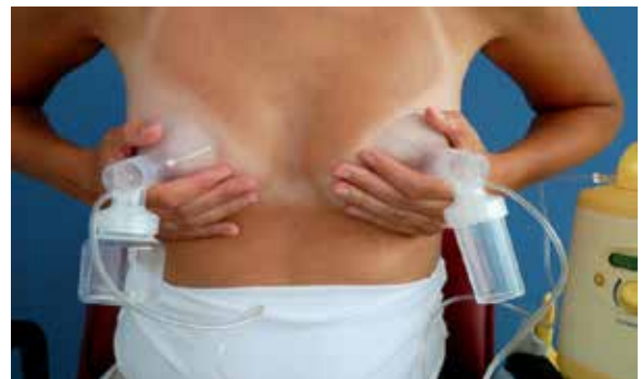
7. Dubbelzijdig afkolven