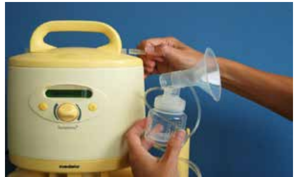
4. Set aansluiten op het kolfapparaat