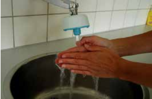
1. Handen wassen