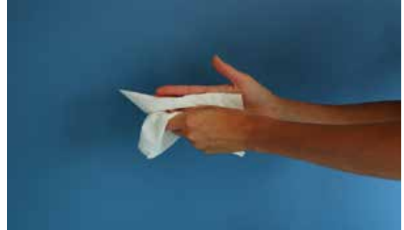
2. Handen goed drogen