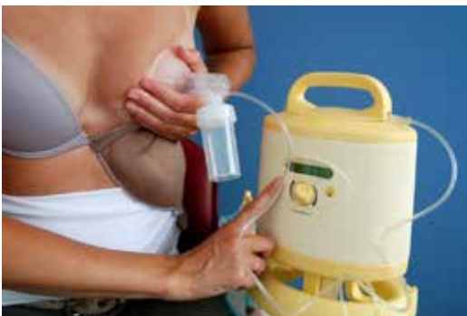
6. Enkelzijdig afkolven