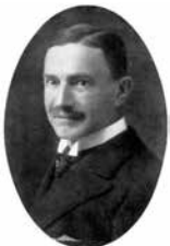
Georg Clemens Perthes (1869–1927)

Let erop dat u bij het afhalen van de materialen in het bezit moet zijn van een geldig legitimatiebewijs. Het 'ziekenhuisbed' zal bij u thuis worden bezorgd.