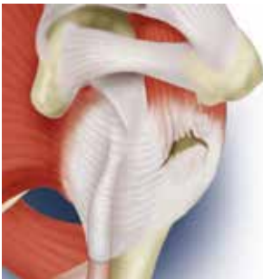
scheur in de rotator cuff

Ook kan krachtsverlies in de arm ontstaan en een eventuele bewegingsbeperking. De behandeling bij een scheur in de cuff is het hechten van de scheur, de zogenaamde cuff repair.